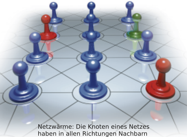
Netzwärme: Die Knoten eines Netzes haben in allen Richtungen Nachbarn

Aber sollten die Piraten dann „wie die anderen“ geworden sein, wird es heißen, wozu brauchen wir euch noch, ihr seid ja „wie die anderen“. Dazu wird es allerdings nicht kommen, denn: Es ist die Netz-Sozialisation der Netz-Identitäten, die vor diesem Monosprech-Double-Bind durch die Print- und TV-Medien schützt.